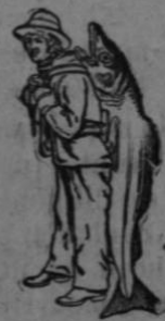
Si en esta Marca Ninguna es Legítima

NO CONTIENE ALCOHOL, GUAYACOL, CREOSOTA NI NINGUNA SUBSTANCIA NOCIVA O IRRITANTE.